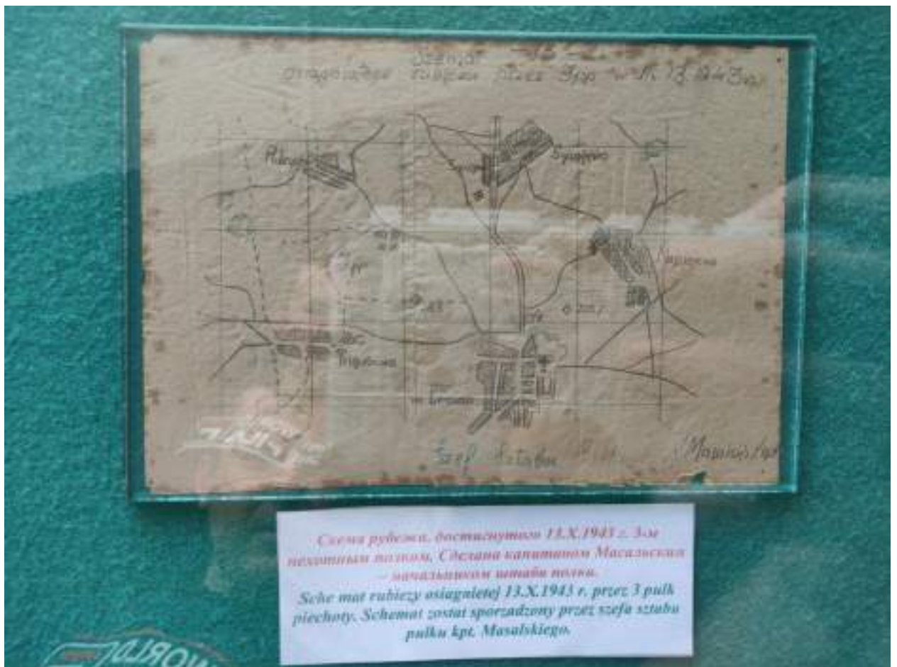
Схема рубежей, достигнутых 13.X.1943 г. 3-м пехотным полком, Сибирским танковым Магдальским - механизированном отрядом полка. Схеми меж рубіжів osiągniętej 13.X.1943 r. przez 3 pułk piechoty. Schemat został sporządzony przez szefa sztabu pułku kpt. Masalskiego.